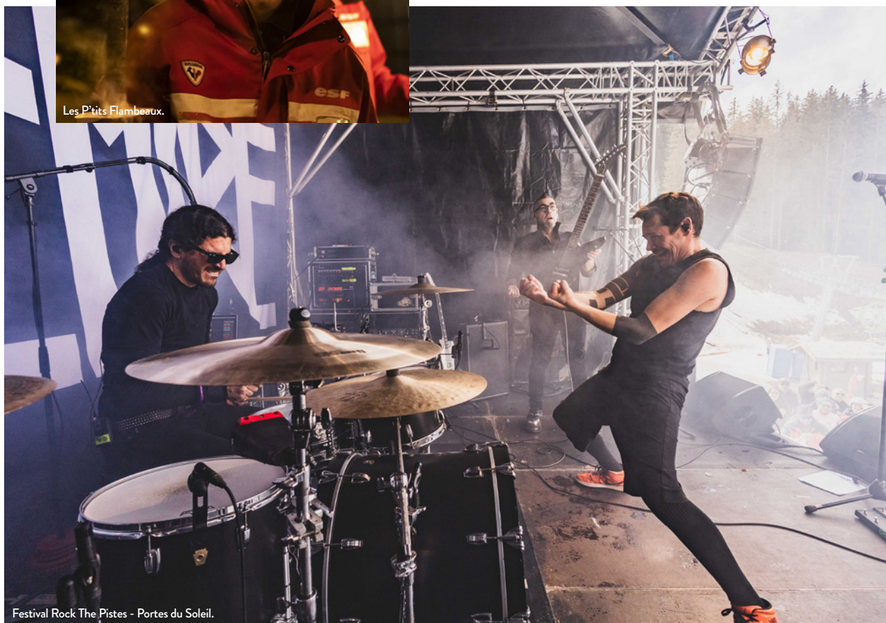
Festival Rock The Pistes - Portes du Soleil.