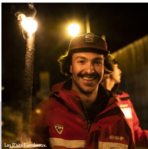
Les P'tits Flambeaux.

La montagne française se mobilise pour les enfants. Initié en 2024 par France Montagnes sous l'impulsion de ses 3 membres fondateurs : l'Association Nationale des Stations de Montagne, Domaines skiables de France et le Syndicat National des Moniteurs du Ski Français, cet événement solidaire national en montagne aura lieu le 25 février. Il a pour objectif de faire connaître la montagne en hiver aux plus jeunes. A l'instar des stations participantes, celle de Châtel organise, en simultané, une descente aux flambeaux (à acheter) avec les moniteurs ESF, ouverte au public. Les fonds sont reversés aux associations « Petits Princes », « Génération Montagne » et « Enfance et Montagne ».