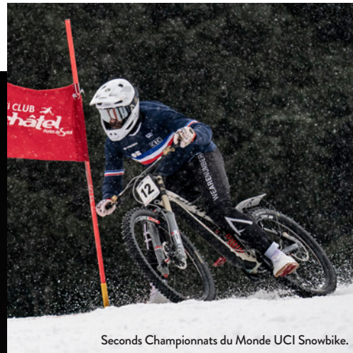
Seconds Championnats du Monde UCI Snowbike.