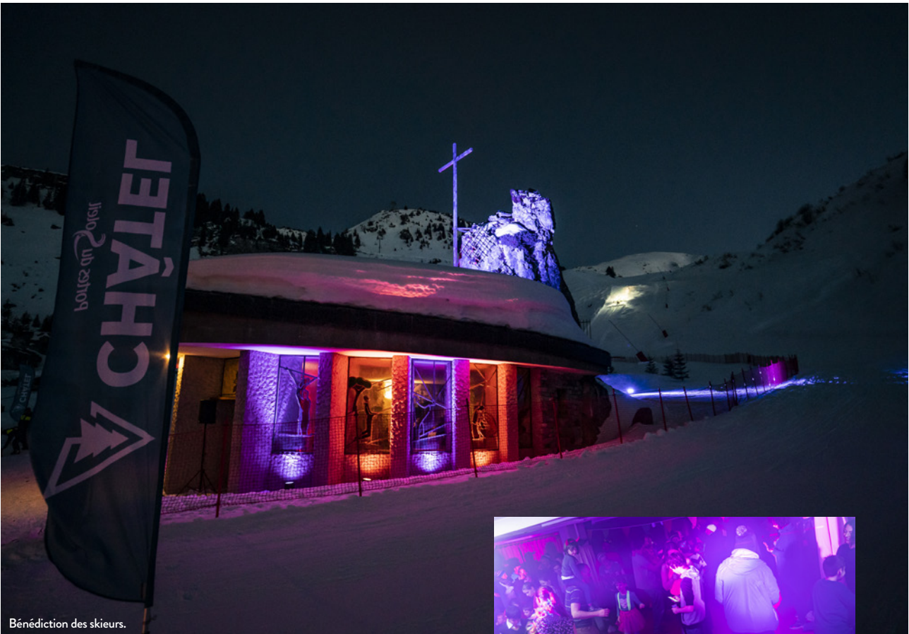
Bénédition des skieurs.