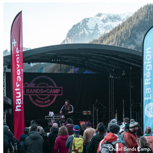
Châtel Bands Camp.

La musique continue en après-ski en station avec des concerts au village donnés par des artistes émergents en stage de professionnalisation, le public musicien étant aussi invité à se produire sur scène. L'ambiance monte en puissance !