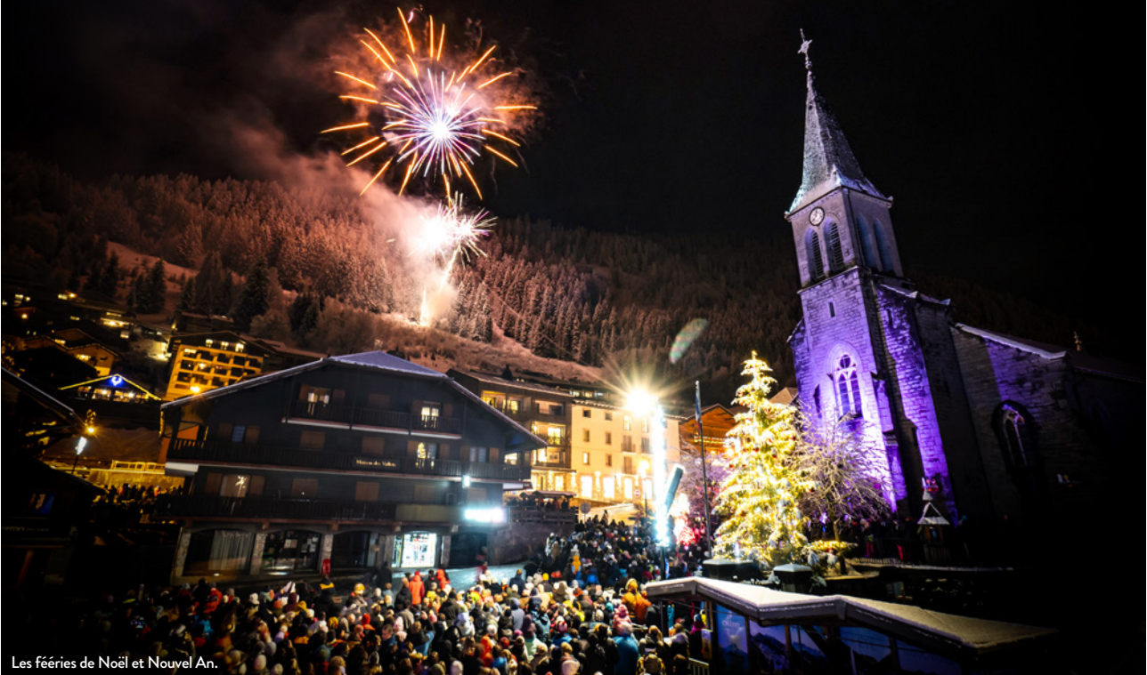
Les fêtes de Noël et Nouvel An.