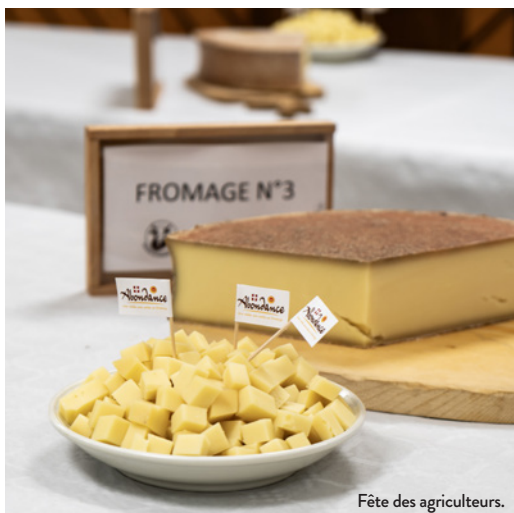
Fête des agriculteurs.